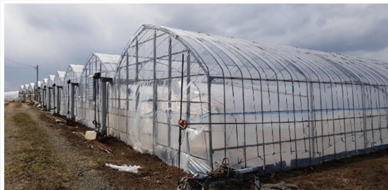
スイカビニルハウス(国内)