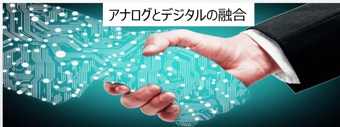
アナログとデジタルの融合