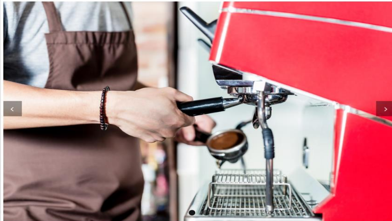
コーヒーショップ(海外)